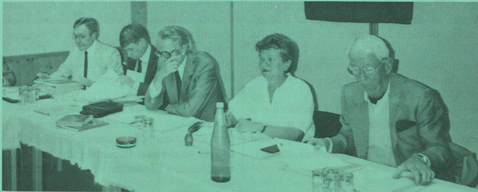
An der Tagung