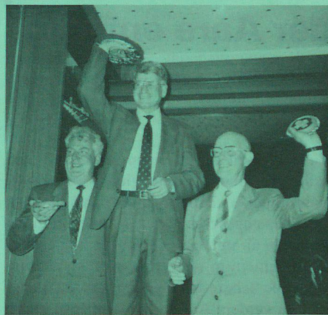
Die Sieger des Quiz. Zu erraten waren 12 Schweizer Lieder.

Le beau temps n'était pas de la partie, mais c'était une belle journée tout de même. La partie officielle du matin passée et après un bon dîner, nous nous retrouvons au débarcadère. Délégués et membres, tout le monde est content de se revoir, de l'ainée de 80 ans à la cadette de 8 mois. Sur le bateau, nous