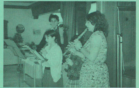
Musikantinnen des Vereins.

jouissons d'une agréable croisière sur le lac de Traun en faisant quelques interruptions pour visiter le chateau Ort et la célèbre église de Traunkirchen. La soirée fut également un triomphe: un magnifique buffet garni, un délice pour la langue et les yeux. Après les discours de ces Messieurs les ministres et