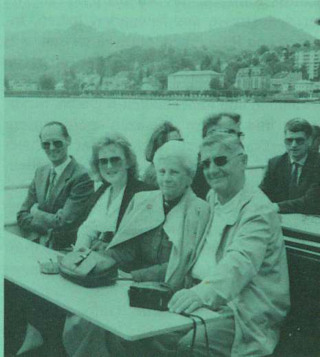
Auf dem Traunsee.

jouissons d'une agréable croisière sur le lac de Traun en faisant quelques interruptions pour visiter le chateau Ort et la célèbre église de Traunkirchen. La soirée fut également un triomphe: un magnifique buffet garni, un délice pour la langue et les yeux. Après les discours de ces Messieurs les ministres et