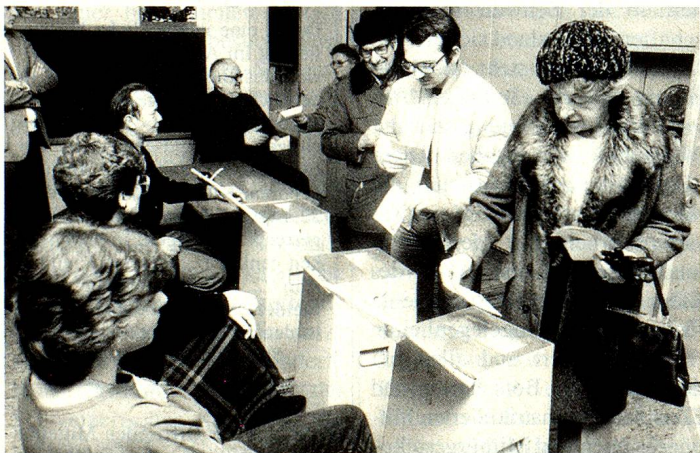
Auslandschweizer werden sich nicht mehr persönlich an die Urne begeben müssen.

Um den Auslandschweizern die Möglichkeit zu geben, sich eine breit abgestützte Meinung zu eidgenössischen Wahlen und Abstimmungen zu bilden, beschloss der Bundesrat ferner, in