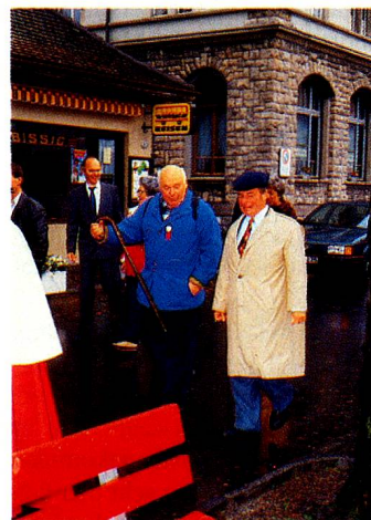
Nationalratspräsident Ulrich Bremi (l.) und Bundesrat Jean-Pascal Delamuraz (r.) in Brunnen.

Zur Überraschung der anwesenden Gäste, zu denen sich auch et-