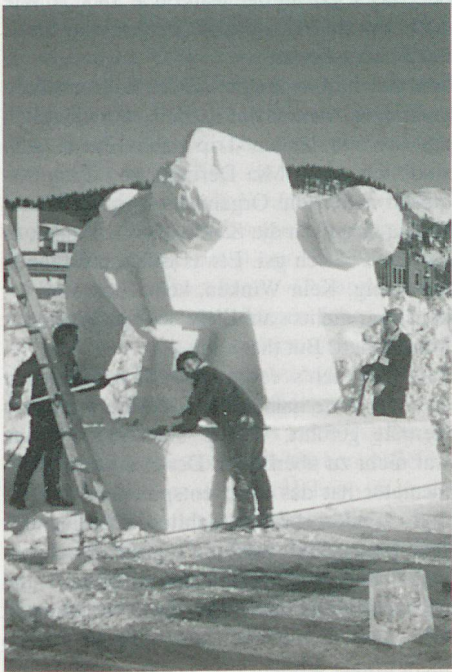
Die Schneeplastik nimmt Gestalt an. (Stand am 9.1.1992)

Das vom Schweizerteam aus dem vorgegebenen Schneeblock von ca. 3 x 3 x 3 m herausgehauene, mit «The Heavy Cross» betitelte Sujet (siehe Foto) hat mich sehr beeindruckt. Fahren doch da vier junge Leute (der fünfte war lediglich als logistische Stütze mitgereist), keiner über 30 Jahre, auf eigene Kosten und mit nur geringfügiger Sponsoren-Unterstützung nach dem fernen Breckenridge und erklären mit ihrer Schneeplastik allen, die es wissen wollten, dass das Schweizerkreuz wegen innen- und aussenpolitischen Schwierigkeiten arg ins Wanken geraten sei (innenpolitisch weil unzählige Weltuntergangsapologeten uns glauben machen wollen, 700 Jahre seien genug, aussenpolitisch weil wir uns im europäischen Integrationsprozess so schwer