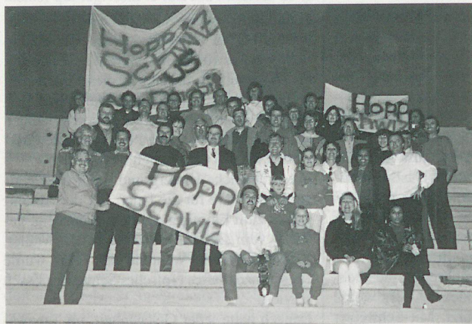
Die Begeisterung der Schweizer Fans aus Abu Dhabi kannte keine Grenzen.

Federation der VAE offeriert wurde, waren wir fast wunschlos glücklich. Nun, (fast) geschlossen sind wir im Stadion in Dubai einmarschiert, um unserer National-Elf am 26.01.92 die dringend benötigte moralische Unterstützung zu geben. Von Dubai liessen sich etwa 15 Schweizer mit der rot-weissen Fahne und einer riesigen Kuhglocke sehen. Wir Abu Dhabianer plazierten uns strategisch in der Südkurve, rollten die Transparente «Hopp Switzerland us Abu Dhabi» aus, Herr Dubs zauberte die Schweizer Fahne hervor, die mitgebrachte Kuhglocke wurde entstaubt – und dann ging's los. Das Stadion (15 000 Plätze) war zum Bersten voll; na ja, eigentlich