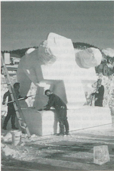
Die Schneeplastik nimmt Gestalt an. (Stand am 9.1.1992)

Das vom Schweizerteam aus dem vorgegebenen Schneeblock von ca. 3 x 3 x 3 m herausgehauene, mit «The Heavy Cross» betitelte Sujet (siehe Foto) hat mich sehr beeindruckt. Fahren doch da vier junge Leute (der fünfte war lediglich als logistische Stütze mitgereist), keiner über 30 Jahre, auf eigene Kosten und mit nur geringfügiger Sponsoren-Unterstützung nach dem fernen Breckenridge und erklären mit ihrer Schneeplastik allen, die es wissen wollten, dass das Schweizerkreuz wegen innen- und aussenpolitischen Schwierigkeiten arg ins Wanken geraten sei (innenpolitisch weil unzählige Weltuntergangsapologeten uns glauben machen wollen, 700 Jahre seien genug, aussenpolitisch weil wir uns im europäischen Integrationsprozess so schwer