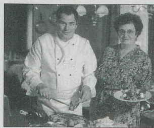
Der Küchenchef und seine Frau

Das exquisite „Geschnetzelte“ und die herrliche Zuger Kirschtorte hob das Stimmungsbarometer und animierte zu reger Diskussion über den gezeigten ORF-