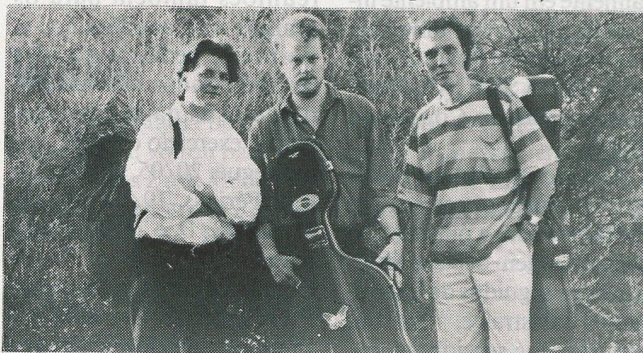
O "Arara Trio"

(Confirme locais e horários na imprensa local)