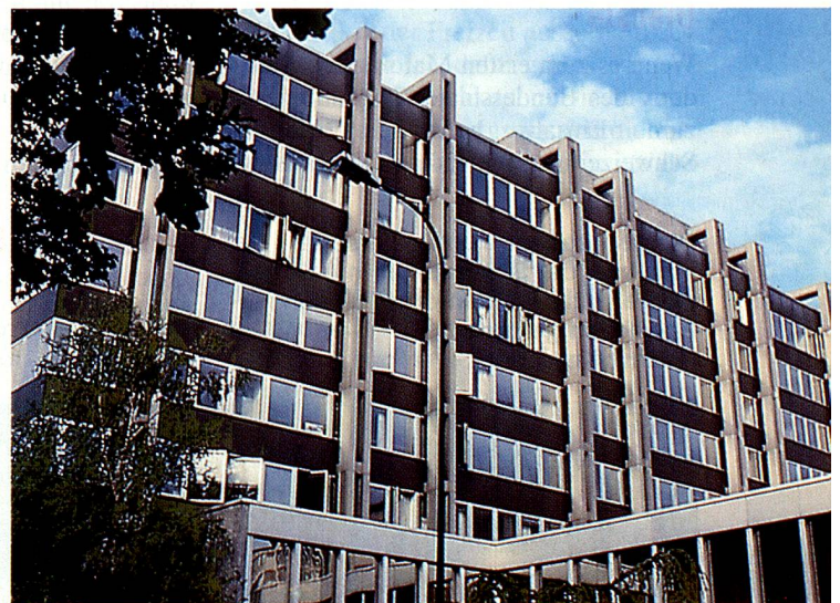
Genf als Sitz zahlreicher internationaler Organisationen. Von links nach rechts: das Gebäude der UNO, der Weltgesundheitsorganisation (WHO), der Weltorganisation für geistiges Eigentum (WIPO) und der EFTA.