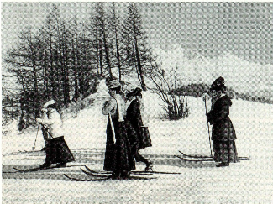
75 Jahre Schweizerische Verkehrszentrale: Skifahrerinnen von anno dazumal.

● In einer Militärkaverne am Sustenpass (Kt. Bern), die der unterirdischen Lagerung von nichtwiederverwertbarem Sprengstoff diente, ist aus ungeklärten Gründen 300–400 Tonnen sprengbares Material explodiert. Die Kaverne selbst wurde unter 50 000 m 3 Fels und Schutt begraben. Sechs Menschen fanden bei diesem Unglück den Tod.