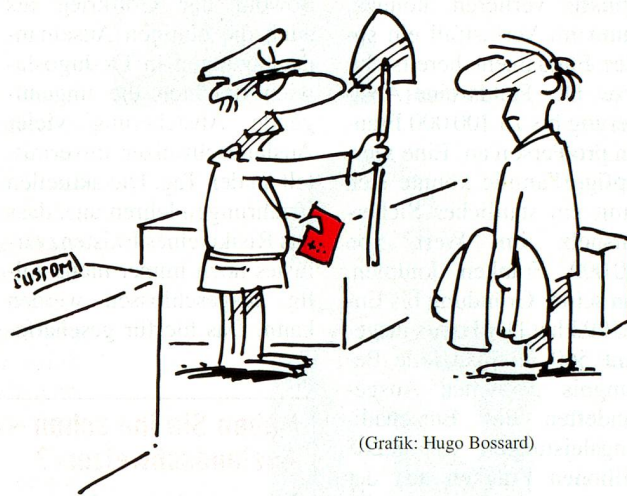
(Grafik: Hugo Bossard)

kommt nur auf 18 Staaten: Abkommen mit Italien, Portugal und Russland sind zwar bereits unterzeichnet wor-