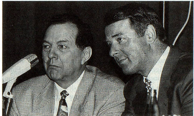
SVP-Bundesrat Adolf Ogi (rechts) an der Seite von Parteipräsident Hans Uhlmann.

der öffentlichen Sicherheit, auf den Abbau der Bürokratie, auf Deregulierung und insbesondere auf eine Ablehnung jeder Form der Integration der Schweiz in die Europäische Union legt.