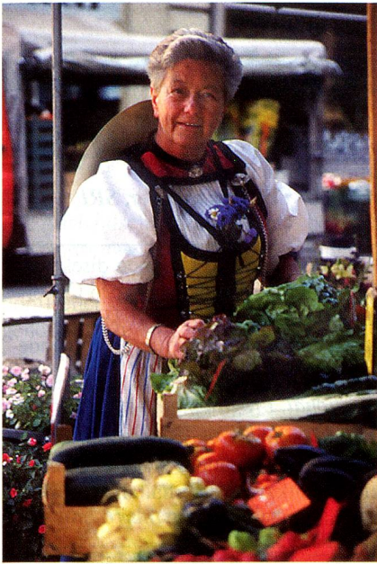
Bern, ein goldener Schnitt zwischen Stadt und Land.