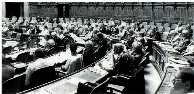
Die gut besuchte Sitzung des Auslandschweizer Rates im Nationalratssaal.

In der Mitte seiner vierjährigen Amtszeit traf sich der Auslandschweizer Rat im Bundeshaus zu seiner ersten öffentlichen Sitzung. Der würdige Rahmen passte zu den wichtigen Themen.