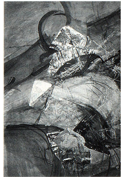
La Fête 1964 37/51 cm tableau de matériaux

Vernissage le 29 mars 1996 à 18.30 heures. Ouvert du mardi au samedi de 14.30–18.30. Les dimanches de 10.00–12.00 et 14.30–18.30. Les œuvres exposées sont à vendre.