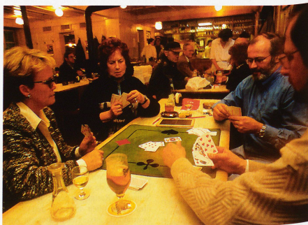
Die «interkulturelle» Jassrunde: Ein vergnüglicher Abend mit lehrreichen Erkenntnissen über das freundeidgenössische Zusammenleben.