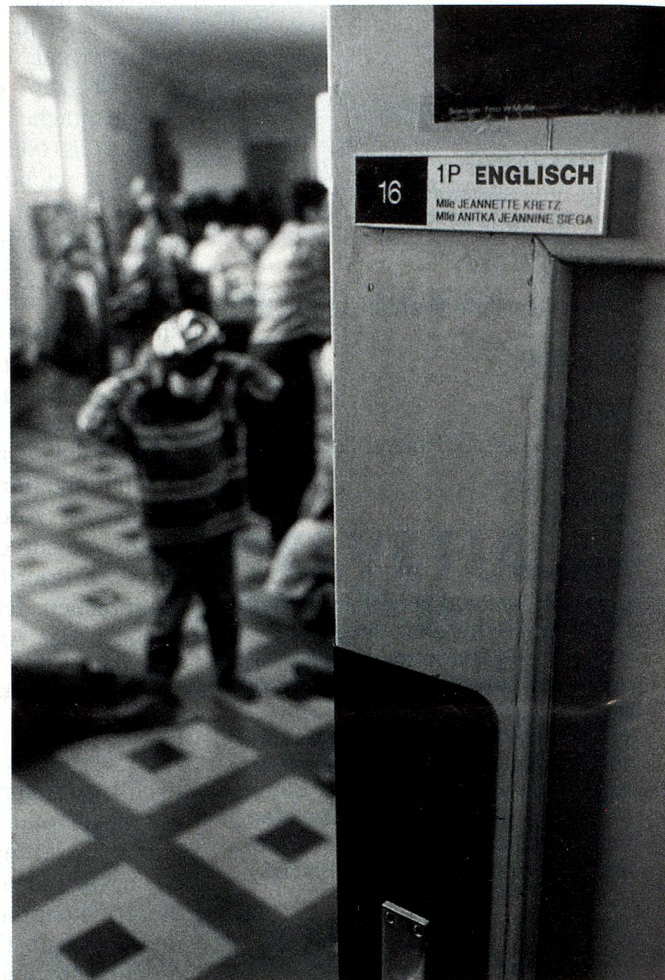
Die Förderung des Frühenglischunterrichts löst heftige Reaktionen aus ...

Statt dessen schielen Schulbehörden, Eltern und Kinder immer unverhohlener nach dem Englisch: In einer Welt, die nach dem Takt der Wirtschaft tanzt, scheint es die einzige Fremdsprache mit Marktwert zu sein. Die französische und die italienischsprachige Schweiz betrachten den Trend als logische Folge einer fatalen Entwicklung. Schon den ausgiebigen Mundartgebrauch der deutschen Schweiz empfinden die Welschen und Tessiner als Kontaktverweigerung. Sie leiden darunter, dass sie in der