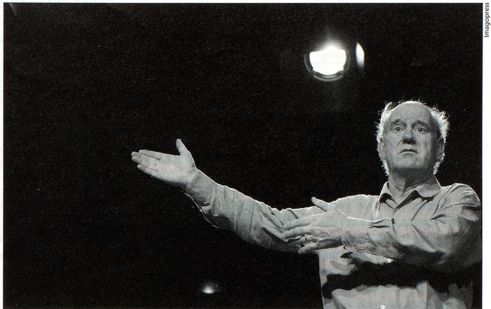
Franz Hohler, witzig, geistreich und manchmal bitter böse – aber immer liebenswert.