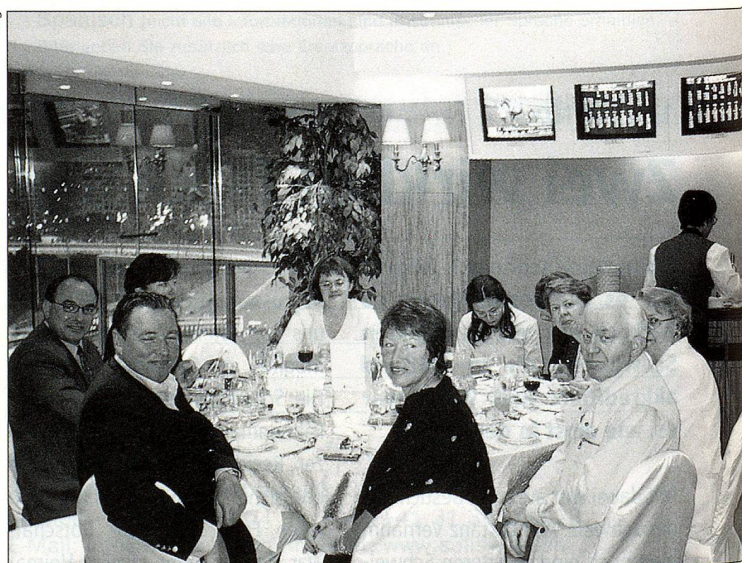
Dreams come true.