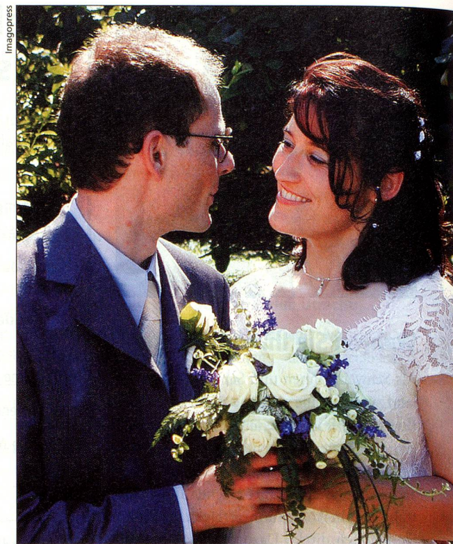
Das Glück lacht auch in der Ferne. Doch sind dabei einige Punkte zu beachten.

Zivilstand und Nationalität benötigt. Soweit erforderlich übersetzt, beglaubigt und überprüft die schweizerische Vertretung die Dokumente und leitet sie über das Eidgenössische Amt für Zivilstandswesen an die zuständige kantonale Aufsichtsbehörde des Heimatkantons weiter. Diese befindet über die Anerkennung der Ehe und die Eintragung in die entsprechenden Zivilstandsregister.