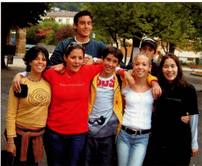
Die Sommerlager auf den Flumserbergen werden wieder Gelegenheit zu neuen Freundschaften bieten.

Auskünfte und Informationen zu den genannten Angeboten unter Auslandschweizer-Organisation (ASO), Jugenddienst Alpenstr. 26, 3000 Bern 16 Tel.: ++41 (0)31 356 61 00 Fax.: ++41 (0)31 356 61 01 youth@aso.ch, www.aso.ch