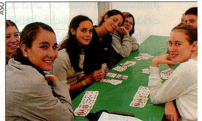
In den Workshops wird nicht nur gearbeitet ...

In den zweiwöchigen Sprachkursen können Auslandschweizer Deutsch oder Französisch lernen. In unserem Workshop bringen wir euch den Finanzplatz Schweiz näher. Mit einer Teilnahme an der Eidgenössischen Jugendsession erlebt ihr die direkte Demokratie der Schweiz hautnah. Unsere aufgeschlossenen Gastfamilien erwarten euch und lassen euch teilhaben am schweizerischen Alltag.