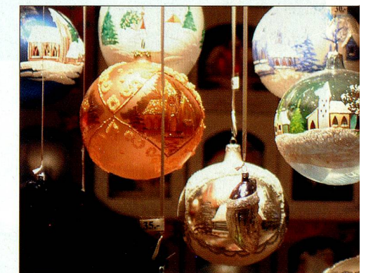
Christbaumkugeln – von Kindern geblasen.