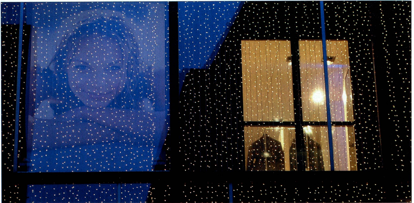
Weihnachtsbeleuchtungen verzaubern die Häuser und bringen Kinderaugen zum Glänzen.