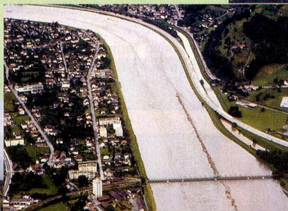
Auch heute noch gefährlich. Rheinhochwasser bei St. Margrethen/Lustenau. Die Vorländer sind meterhoch überflutet.