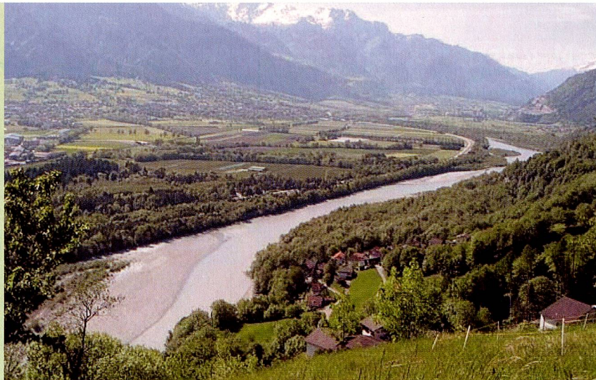
Eine der letzten noch natürlichen Flusslandschaften in der Mastrilser-Au (GR).

Rheinbähnchen mit Personenzug auf alter Eisenbrücke bei Lustenau