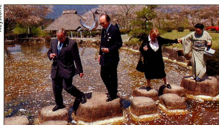
Bundespräsident Schmid an der Weltausstellung.

23. März. Eröffnung der Weltausstellung im japanischen Aichi. Die kulturelle Schweiz begnügt sich im «Land der aufgehenden Sonne» keineswegs mit dem Schweizer Pavillon. Pro Helvetia organisiert bereits seit zwei Jahren im ganzen Land ein reichhaltiges Programm, um das zeitgenössische Schweizer Kulturschaffen zu präsentieren. Am 16. April