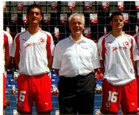
Köbi Kuhn, Nationaltrainer

Auf Grund der grossen Zahl von Zuschriften, welche die Neugestaltung zum Thema haben, finden Sie in dieser Nummer eine zusätzliche Seite mit Leserbriefen. HEINZ ECKERT