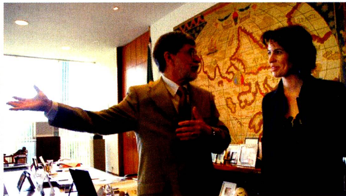
Os ministros Celso Amorim (Relações Exteriores) e Doris Leuthard, na entrevista coletiva para a imprensa em Brasília

A visita da ministra é o primeiro passo para se colocar em prática a estratégica econômica do