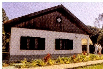
O acolhedor Retiro Suíço

No caso de pacientes em convalescença, o Retiro também é disponível para estadia temporária. Há vagas disponíveis e se desejar maiores informações, visite no site www.beneficencia-suica.com.br ou entre em contato pelo telefone: 11 / 5071-2910.