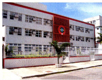
A Escola Suíço-Brasileira na Rua Corrêa de Araújo na Barrinha