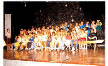
Cerimônia da passagem dos alunos para o 2º ano do Ensino Fundamental

Parabéns aos alunos e professores pelo êxito! A média dos nossos alunos nas provas IB (International Baccalaureate) foi de 30 pontos, mantendo um bom desempenho e abrindo o caminho para os estudos no exterior. Este resultado é uma demonstração de que os alunos da Escola Suíço-Brasileira de São Paulo estão conseguindo atingir os objetivos propostos.