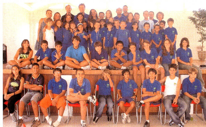
Alunos e professores do Colégio Marie Jost.