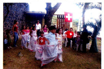
A presença de muitas crianças alegrou a festa.