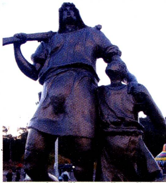
A estátua de Guilherme Tell, medindo quase 4 metros

Já se passaram duas décadas desde a inauguração da Queijaria Escola Suíça, no dia 1º de agosto de 1987, na Estrada Nova Friburgo - Teresópolis, na região serrana do Estado do Rio de Janeiro.