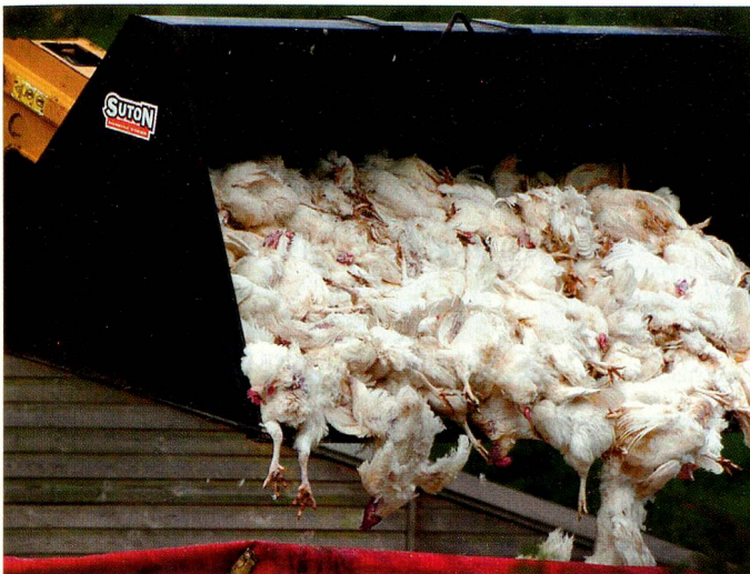
Notgeschlachtete Hühner in England im April 2006.

Ecuador (nur direkt bei Roche), Georgien, Guatemala, Honduras, Hongkong, Indien, Indonesien, Iran, Israel, Jamaika, Jordanien, Kambodscha, Kenia, Kolumbien (nur für Firmen und Behörden), Kongo, Kroatien, Kuwait, Laos, Libanon, Libyen, Malaysia, Mauritius, Marokko, Mazedonien, Mexiko, Montenegro, Nicaragua, Oman, Pakistan, Paraguay, Peru, Philippinen, Qatar, Rumänien, Russland, Saudi-Arabien, Serbien, Singapur, Sri Lanka, Südafrika, Taiwan, Thailand, Tunesien, Turkmenistan, Ukraine, Uruguay, Venezuela, Vereinigte Arabische Emirate, Vietnam.