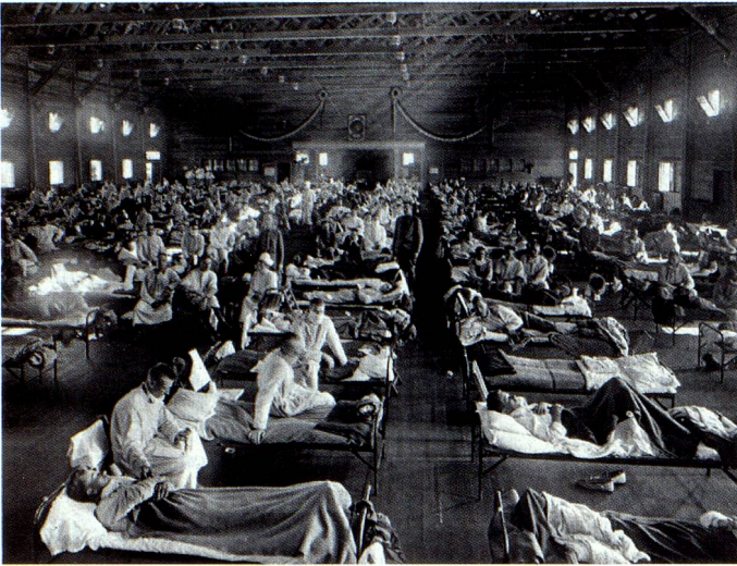
Notspital mit Grippekranken in Fort Riley, Kansas, im Jahr 1918.