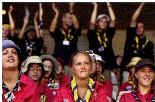
100 Jahre Pfadi in der Schweiz.

Das diesjährige Weltwirtschaftsforum (WEF) in Davos unter dem Motto «Veränderungen im globalen Machtgefüge mitgestalten» endete mit einem matten Appell an Hoffnung und Frieden. Die beiden grossen Debatten über die Doha-Runde (Liberalisierung des Handels zu Gunsten der armen Länder) und das Klima vermochten das Hauptziel der Wirtschaftsführer, das Wirtschaftswachstum, nicht in