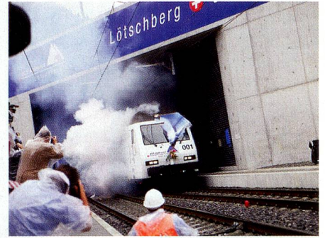
Neat-Baustelle in Mitholz (links), Portal-Baustelle bei Raron neben der Rhone im Wallis (Mitte), Eröffnungsfeierlichkeiten am 15. Juni 2007 ebenfalls in Raron (rechts).

Offiziell eröffnet wurde der Lötschberg-Basistunnel am 15. Juni dieses Jahres. Aber voll in Betrieb gehen wird er erst mit dem Fahrplanwechsel im Dezember. Viel nationale und internationale Prominenz wohnte der Eröffnung bei, darunter Bundesrat Moritz Leuenberger. «Der Lötschbergtunnel ist, bei aller Bewunderung für die technische Meisterleistung und die grosse Leistung aller Beteiligten, viel mehr als ein grandioses Loch durch den Berg», sagte der Verkehrsminister. Er stehe nämlich für «die konsequente Verwirklichung der schweizerischen Verlagerungspolitik, die heute in ganz Europa als vorbildlich gilt». Tatsächlich erlaubt der neue Tunnel einen Ausbau der Kapazitäten im