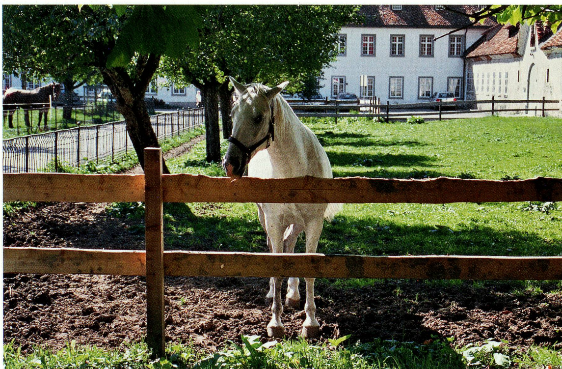
Das Gestüt des Klosters Einsiedeln gilt als das älteste in Europa.

viert und die Handwerker der klostereigenen Werkstätten (Schreiner, Schlosser, Maurer, Maler usw.) haben alle Hände voll zu tun. Die Renovierungsarbeiten werden 2008 beendet sein. Eine erfahrene Pferdezüchterin leitet das Gestüt. Zudem kümmern sich vier Angestellte um die Pferde und die Reitstunden. Die Tiere werden mehrmals in der Woche von einem Tierarzt betreut. Während der tausendjährigen Geschichte der «Einsiedler»-Zucht wurden verschiedene Einkreuzungen vorgenommen. Der sportliche Charakter dieses wundervollen Pferdes, dessen historische Wurzeln ins 10. Jahrhundert zurückreichen, blieb jedoch erhalten.