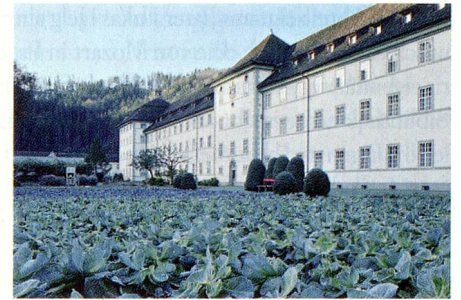
Das Kloster versorgt sich selbst.