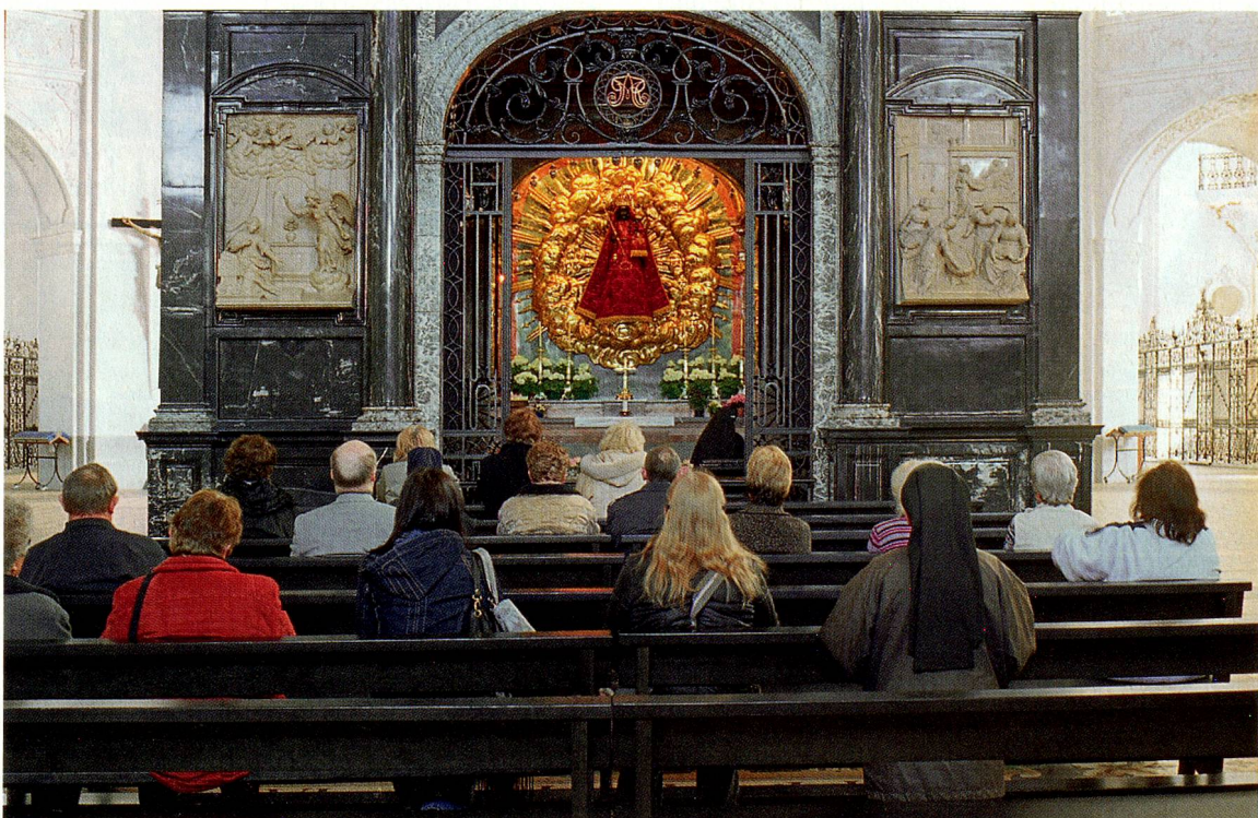
Ein Ziel für Pilger: Einsiedelns schwarze Madonna in der Stiftskirche.

Dynamik des Ortes. Mit seinem altertümlichen Schlüsselbund öffnet der Lateinlehrer Tür um Tür. Drei Schulen gehören zur Abtei: ein humanistisches Gymnasium (gegründet 1839, 340 Schülerinnen und Schüler), eine theologische Schule (1620) und eine Bäuerinnenschule im Kloster Fahr (1944). Durch die Fenster blickt man auf die Sportplätze des Gymnasiums, die umfassend renoviert werden sollen. In der Musikbiblio-