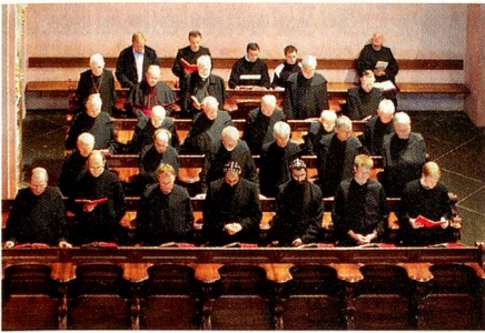
Mönche beim Gebet.