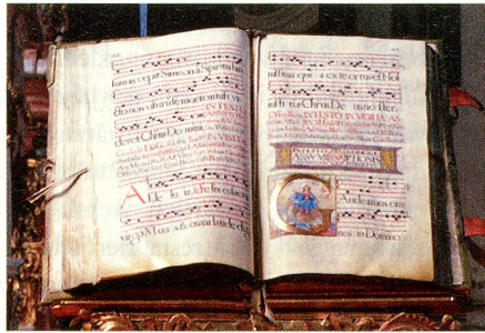
Handschrift aus der Bibliothek.