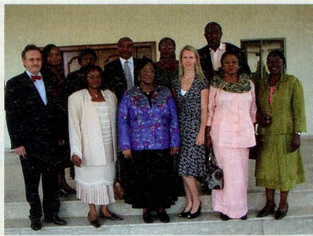
Launch of a Swiss-funded project to combat human trafficking, Calabar, Nigeria

The new function is mainly aimed at enhancing dialogue between the Swiss and respective partner