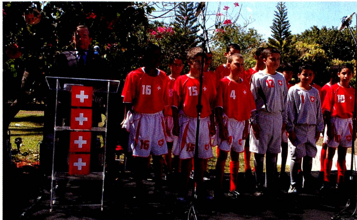
O Embaixador Rudolf Baerfuss e a turma do Centro Educacional de Brazlândia

último em romanche, cantados pela turma do Centro Educacional de Brazlândia, a mesma que defendeu a camisa suíça na Euro Copa Mirim 2008 em junho passado. À noite, a festa para os compatriotas suíços do Distrito Federal e de Goiás seguiu as tradições populares do 1º de agosto: o toque dos sinos seguido da reprodução do discurso do Presidente da Confederação, Pascal Couchepin, a fogueira do 1º de agosto, raclette e salsichão. Tudo regado a muita animação e música ao vivo de alta qualidade.