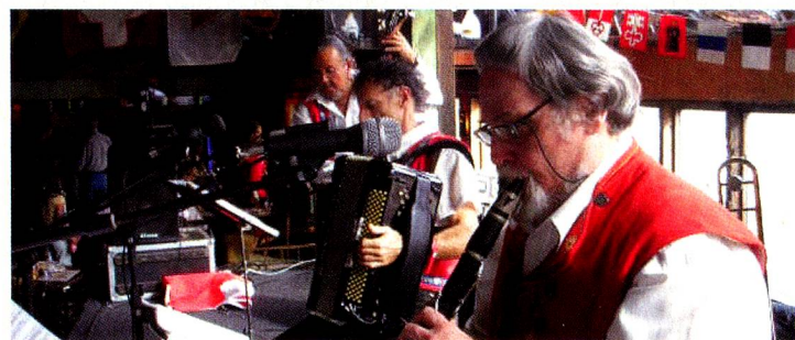
O "Trio Infernal", do Rio de Janeiro, animou a festa.