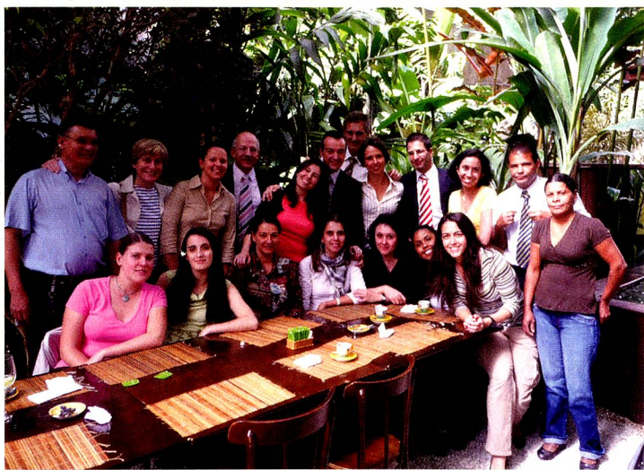
A equipe do Consulado Geral se reuniu para se despedir do Cônsul Rudolf Wyss

No dia 30 de agosto de 2008, o Cônsul Rudolf Wyss encerrou sua missão no Brasil. Ele foi intitulado com a função de Conselheiro de Embaixada para a Embaixada da Suíça no Estado do Kuwait.