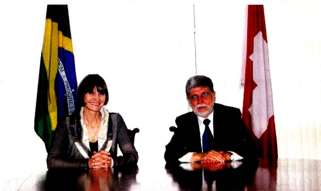
A Conselheira federal Micheline Calmy Rey e o Ministro Celso Amorim

Nações Unidas. A senhora Calmy-Rey encontrou-se, igualmente, com o Ministro da Justiça, Tarso Genro. No dia 15 de agosto, em São Paulo, a Conselheira Federal reuniu-se com representantes de empresas suíças no país que lhe expuseram os projetos sociais que desenvolvem no Brasil. Após uma breve visita do Consulado Geral, a Ministra encontrou-se com uma centena de membros da comunidade suíça. Ela aproveitou a oportunidade para agradecer os compatriotas pelas atividades desenvolvidas no Brasil, preservando os valores suíços. "Com uma comunidade suíça tão ativa e tão forte, eu não tenho nenhuma dúvida sobre a durabilidade da amizade de nossos dois países", disse a Conselheira Federal no encontro com a colônia suíça.