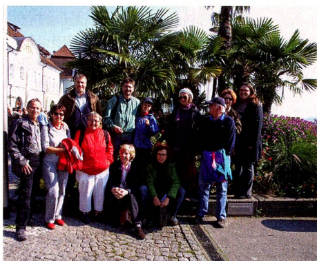
Blauer Himmel, blauer See und schon leicht gefärbtes Laub: Wetter wie im Bilderbuch genossen Mitglieder der Schweizer Gesellschaft Stuttgart am Bodensee.