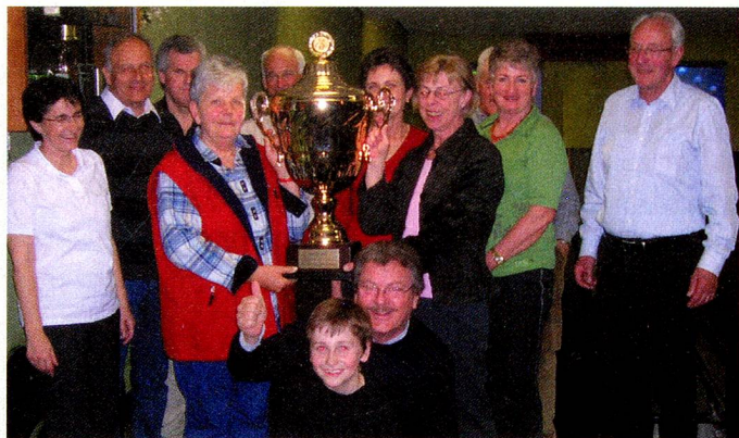
Resultate Kegelabend 2009