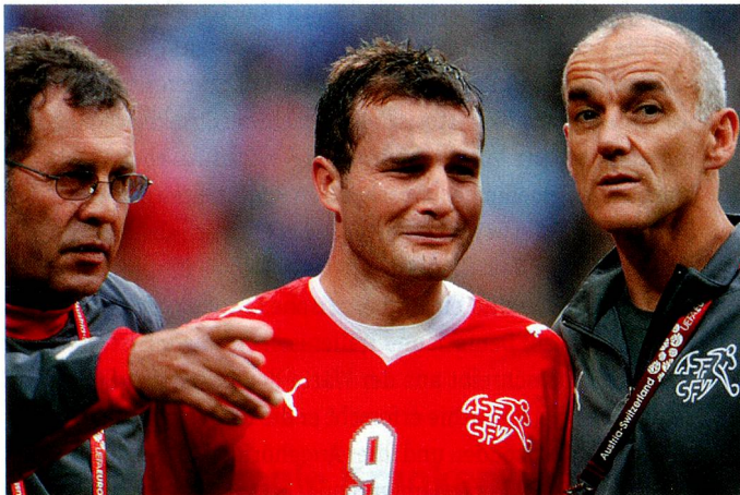
Der Kapitän der Schweizer Fussballnationalmannschaft Alexander Frei verletzt sich am Euro 08-Eröffnungsspiel gegen Tschechien.