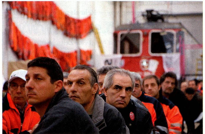
Didier Ruef: Bahnarbeiter im Streik. Der Restrukturierungsplan der SBB Cargo in Bellinzona sieht die Entlassung von 200 Arbeitern vor.