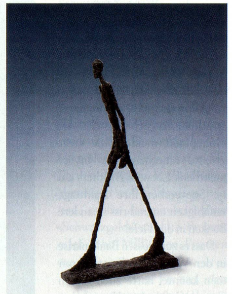
Alberto Giacometti; Homme qui marche II, 1960, Schreitender Mann II; Bronze, 189 × 26 × 110 cm; Fondation Beyeler, Riehen.