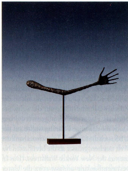
Alberto Giacometti; La main, 1947, Die Hand; Bronze, 57 × 72 × 3,5 cm; Privatsammlung, Schweiz.