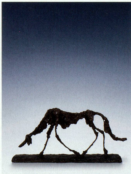
Alberto Giacometti; Le chien, 1951, Der Hund; Bronze, 46 × 98,5 × 15 cm; Alberto Giacometti-Stiftung, Zürich.