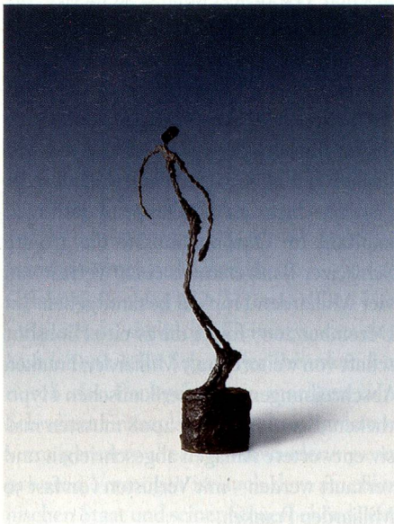
Alberto Giacometti; L'homme qui chavire, 1950, Taumelnder Mann; Bronze, 60 × 14 × 22 cm; Kunsthaus Zürich.