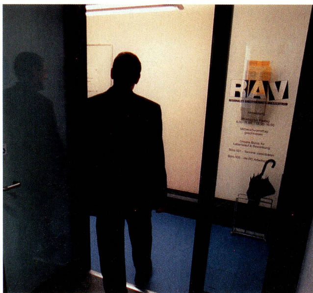
Die Finanzkrise hat Tausende um ihren Arbeitsplatz gebracht, die Arbeitsämter haben wieder Hochbetrieb.

Myret Zaki: UBS am Rande des Abgrunds, Tobler Verlag, Altstätten 2008, CHF 29.90 (französische Originalausgabe: Editions Favre SA, Lausanne) Dokumentationszentrum www.doku-zug.ch