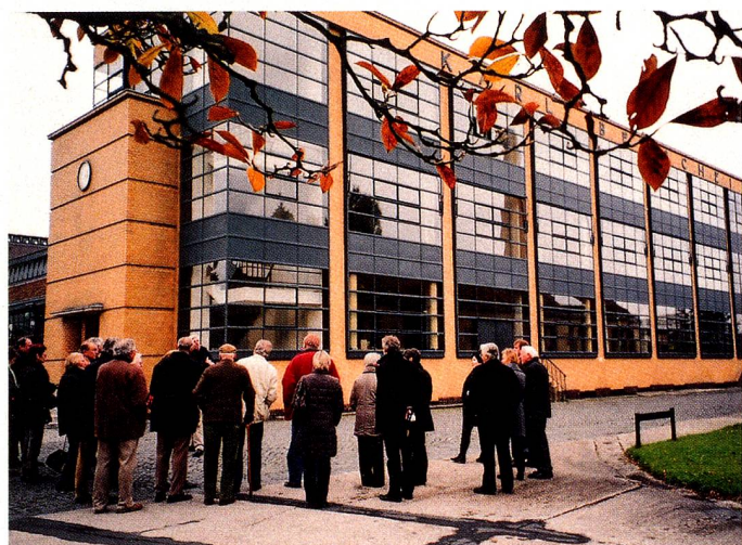
Die Schweizerisch-Deutsche Gesellschaft Hannover vor dem von Walter Gropius erbauten Fagus-Werk, das in keiner Geschichte der neueren Architektur fehlt.