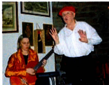
... quand l'oiseau arrive ... s'il arrive... ! Pour faire le portrait d'un oiseau, de Jacques Prévert.

Les deux artistes, dont le professionnalisme n'est plus à démontrer, nous ont fait revivre