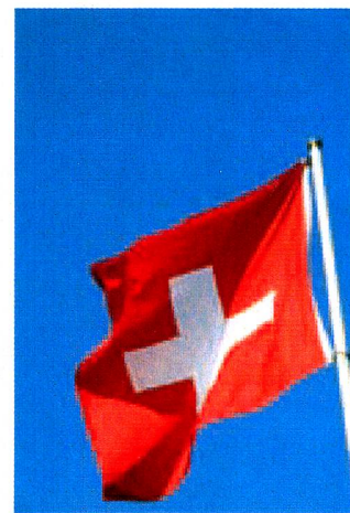
Am 1. August wird in Vettweiß die Schweizer Fahne gehisst.

Für Interessierte ist dies eine passende Gelegenheit die teilnehmenden Vereine kennen zu lernen. Wir freuen uns über jeden Gast.