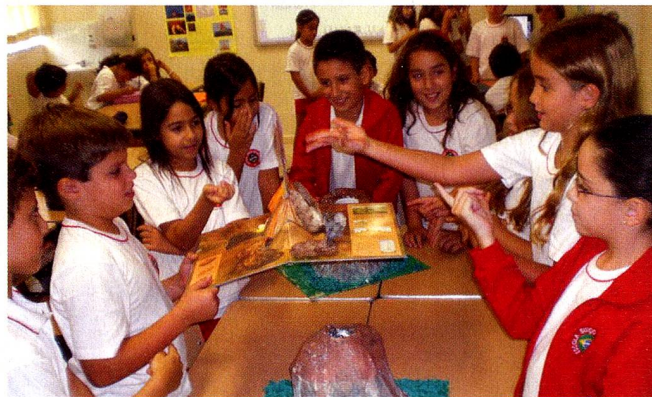
Após uma pesquisa sobre os vulcões, os alunos do 4º ano construíram uma maquete.

A Escola Suíço-Brasileira Rio de Janeiro foi recentemente, autorizada a oferecer o programa do IB Diploma e aceita como escola candidata para a implementação do Programa dos Anos Primários (PYP).