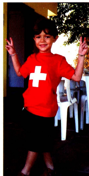
Os torcedores suíços em Salvador já se preparam para a Copa do Mundo 2010 !

Na Casa Suíça em Salvador, o time suíço, vice-campeão, contou com uma torcida organizada que se reuniu em torno de um farto churrasco para assistir à final e acompanhar a partida, ensaiando para a Copa do Mundo 2010, no próximo mês de junho na África do Sul. Todos os jogos que a Suíça vai disputar serão transmitidos na Casa Suíça, contando com o maior número possível de torcedores suíços!