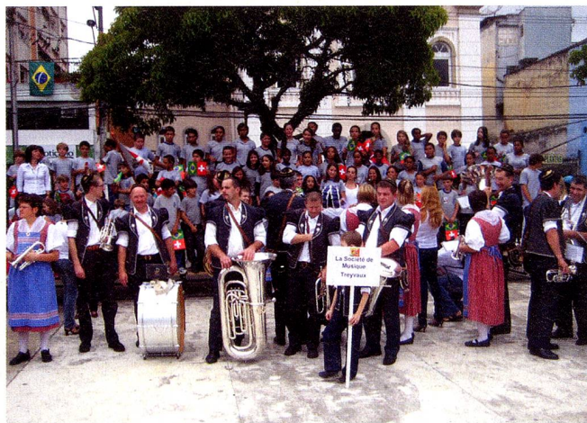
A Société de Musique de Treyvaux desfilou em trajes típicos.