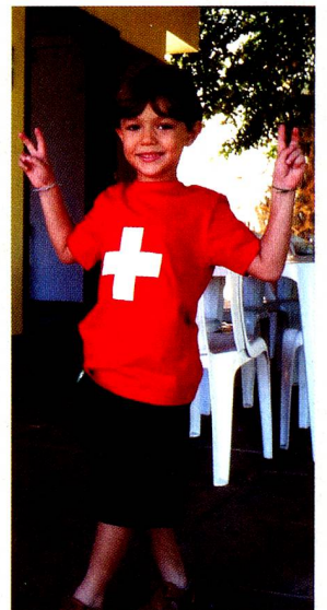
Os torcedores suíços em Salvador já se preparam para a Copa do Mundo 2010 !

Na Casa Suíça em Salvador, o time suíço, vice-campeão, contou com uma torcida organizada que se reuniu em torno de um farto churrasco para assistir à final e acompanhar a partida, ensaiando para a Copa do Mundo 2010, no próximo mês de junho na África do Sul. Todos os jogos que a Suíça vai disputar serão transmitidos na Casa Suíça, contando com o maior número possível de torcedores suíços!