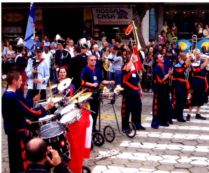
A banda „Guggenmusik Trois Canards“ empolgou o público.

Os 330 suíços vindos do cantão de Fribourg passaram primeiro, saudando as gerações de famílias de descendentes nascidos no Brasil. O desfile teve a participação de numerosas bandas, grupos artísticos e folclóricos, corais de crianças e de adultos, da Suíça e de Nova Friburgo. As escolas de samba de Nova Friburgo fecharam o cortejo com muita animação.