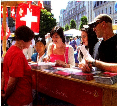
«Braunschweig international»: Das Publikum zeigt reges Interesse am Schweizer Stand.

Am 5. Juni präsentierten wir am Fest der Kulturen die Schweiz mit Prospekten und