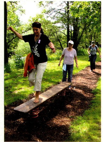
Ein Spass für alle: balancieren auf dem Wackelbrett.