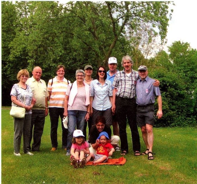
Nach dem Barfussparcour: Die Füße sind gewaschen und abgetrocknet.

ein vorzügliches Mittagessen: ein herrliches Zürcher Geschnietzeltes mit einer wunderbaren hausgemachten Schweizer Rösti. Das schöne dabei war, es konnte wieder mal «schwyzerdütsch gredet wärde».