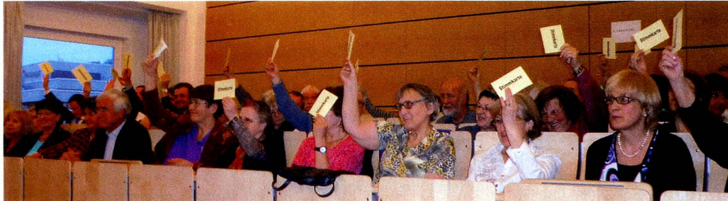
Mitbestimmen macht offensichtlich Spass: Mitglieder der Schweizer Gesellschaft Stuttgart