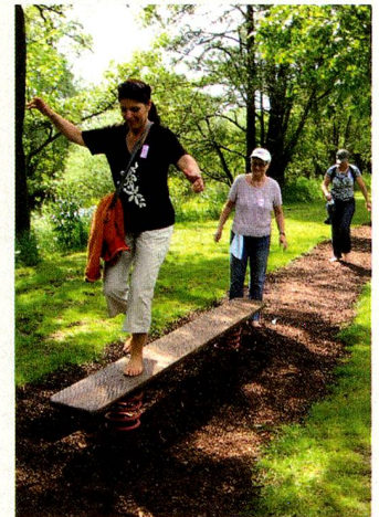
Ein Spass für alle: balancieren auf dem Wackelbrett.