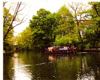
So idyllisch ist es mitten in Braunschweig. Für die Flossfahrt auf der Ocker hätte es jedoch ein paar Grad wärmer sein dürfen.