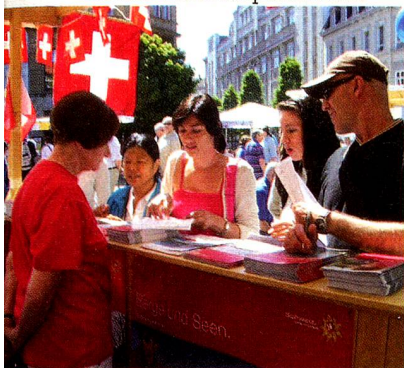
«Braunschweig international»: Das Publikum zeigt reges Interesse am Schweizer Stand.

Am 5. Juni präsentierten wir am Fest der Kulturen die Schweiz mit Prospekten und