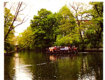
So idyllisch ist es mitten in Braunschweig. Für die Flossfahrt auf der Ocker hätte es jedoch ein paar Grad wärmer sein dürfen.