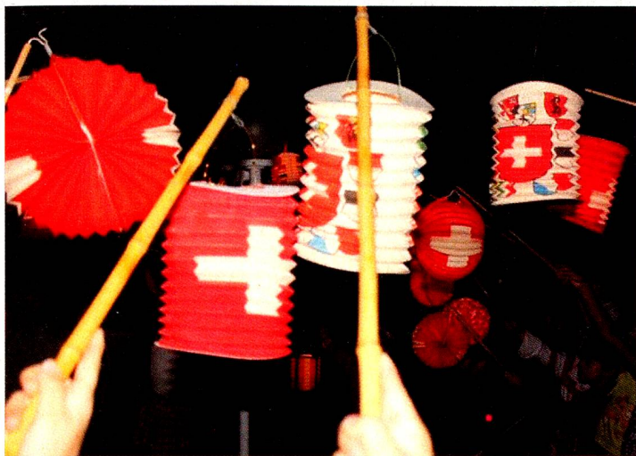
As crianças com bonitos lampiões, com reprodução das bandeiras suíças, animaram a festa.

Com uma participação recorde de mais de 280 Suíços e amigos, a Festa do 1º de Agosto deste ano, celebrada na Casa Suíça, foi um grande sucesso.