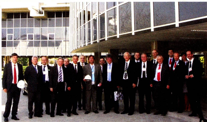
O Conselheiro Federal Didier Burkhalter (6º a partir da esquerda) e a delegação Suíça no CENPES, Centro de Pesquisas da Petrobras, no dia 27.08.2010.

Visita ao Brasil do Conselheiro Federal Didier Burkhalter