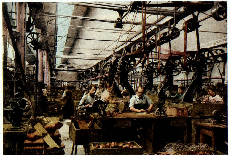
Die Schreinerei der Schuh- fabrik C.F. Bally in Schönen- werd, um 1900