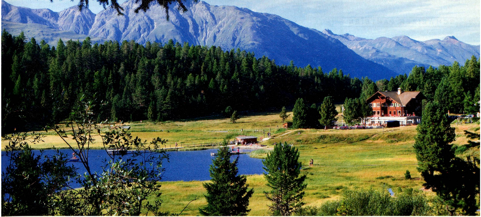
Hotel Lej da Staz, Stazersee, St. Moritz