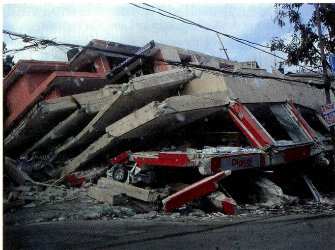
zerinnen und Schweizern in Haiti wirkungsvoll helfen.