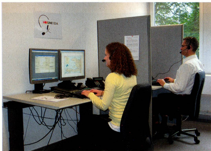
Mitarbeitende der Hotline des EDA geben Auskunft

■ Geben Sie der Schweizer Vertretung jeweils möglichst umfassende Kontaktdetails von Verbindungspersonen an, von Ihren nächsten Verwandten und Freunden im Gastland und in der Schweiz. Antworten Sie jeweils unbedingt auf entsprechende