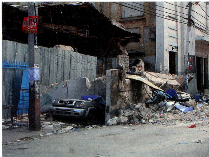
Trotz erheblicher Schwierigkeiten konnte das EDA den in Not geratenen Schwei-