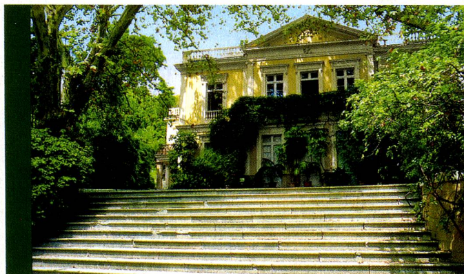
La Concepción: Casa-Palacio

Der Garten lädt zu allen vier Jahreszeiten zum Besuche ein. Man findet tropische Pflanzen und Bäume aus aller Herren Länder wie zum Beispiel Riesenficusse, majestätische Araukarien, mächtige Strelizien, Palmen verschiedenster Art, einen fantastischen Drachenbaum von den Kanarischen Inseln, Riesensparadiesvögel, Wälder mit hohem Bambus usw. Im Frühling ist der traumhafte Glyzinienpark zu bewundern. Im Sommer stehen vor allem die farbigen Seerosen hervor. Dann ist es im