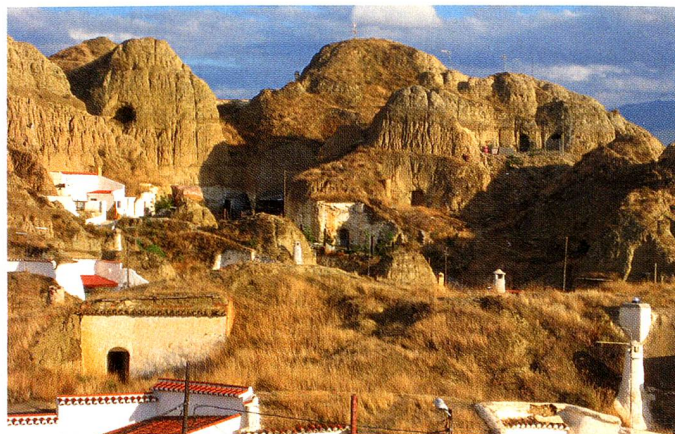
Kamine in Guadix unter welchen sich Höhlenwohnungen befinden.

Im Nordosten der Provinz Granada liegt die Stadt Guadix, welche vor allem berühmt ist durch seine in die Erde gebauten Höhlenwohnungen. Wegen der besonderen Beschaffenheit der Erde, die sich in dieser Gegend im Verlauf der Jahre entlang des Flusses Guadix angestaut hatte, war es möglich ganze Häuser direkt in die Erdhügel zu bauen. Solche Höhlenwohnungen gibt es schon etwa seit 2000 Jahren, nur sind sie mit der Zeit moderner geworden. Zumeist sieht man nur gerade aus dem Boden herausragende Kamine, welche der Lüftung dienen und etwa noch die Eingangsfront.