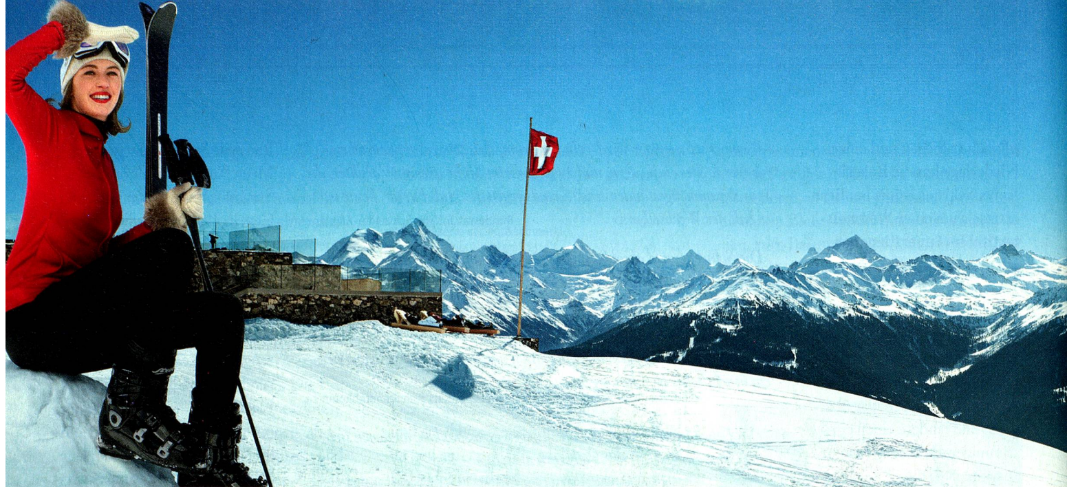
Chetzeron, Crans-Montana, Wallis