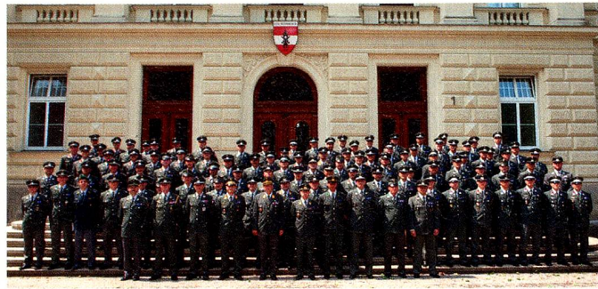
HUAk MilFü3 2011

des Gruppenkommandantenlehrganges und unser Lehrgang gemeinsam trainiert. Auf dem riesigen Truppenübungsplatz Allentsteig (157 km 2 ) im niederösterreichischen Waldviertel wurden in Kompaniestrukturen vor allem Tätigkeiten, die in den Auslandseinsätzen und in multinationalen Verbänden zur Anwendung kommen, geübt.