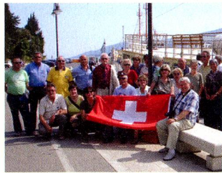
Die Teilnehmer der Jahresversammlung vom 21. Mai 2011 in Rabac.