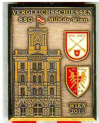
Die Medaille 2011 „Radetzkykaserne“