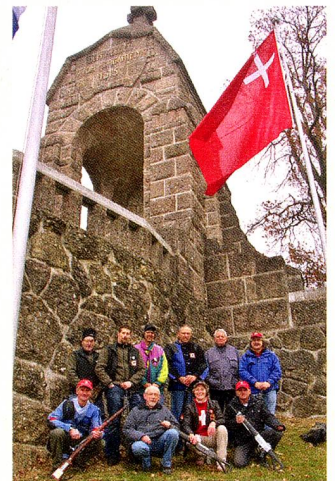
Unsere Schützen vor dem Morgarten-Denkmal.

Als letztes Schieszen steht immer am 15. November das Morgartenschieszen auf dem Programm. Dieses Jahr mussten