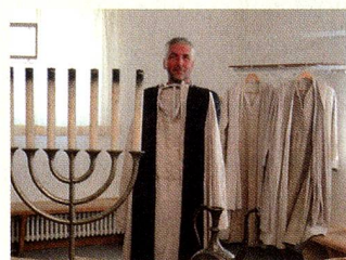
Wer ist dieser „Passionsspieler“?