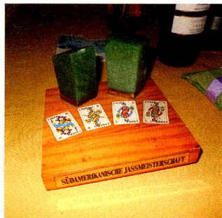
Este ano, o tradicional troféu ficou com o campeão Alfred Ganz.