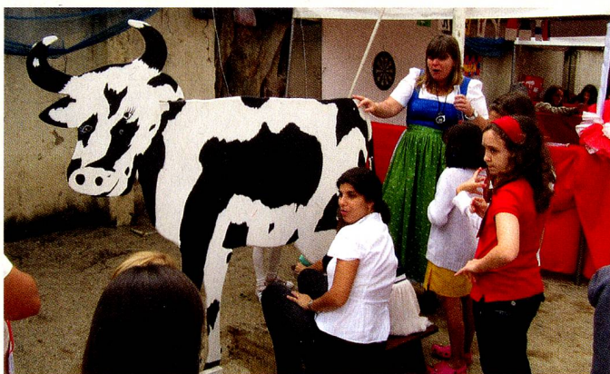
Na Festa Suíça, a brincadeira de tirar o leite da vaca fez sucesso!

Na ocasião, contamos com a presença de muitos compatriotas, amigos da Suíça e famílias da Escola, que tiveram a oportunidade de vivenciar um pouco da cultura local, bem como desfrutar da gastronomia e das brincadeiras típicas. A festa encerrou com o tradicional cortejo de lanternas.