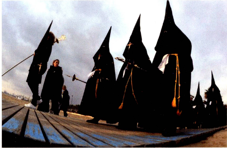
Imposant: Prozession in Valencia.

Manche Teilnehmer tragen bei der Prozession eiserne Ketten und fügen sich damit tiefe Wunden zu. Die Gewänder dienten der Anonymität der Gläubi-