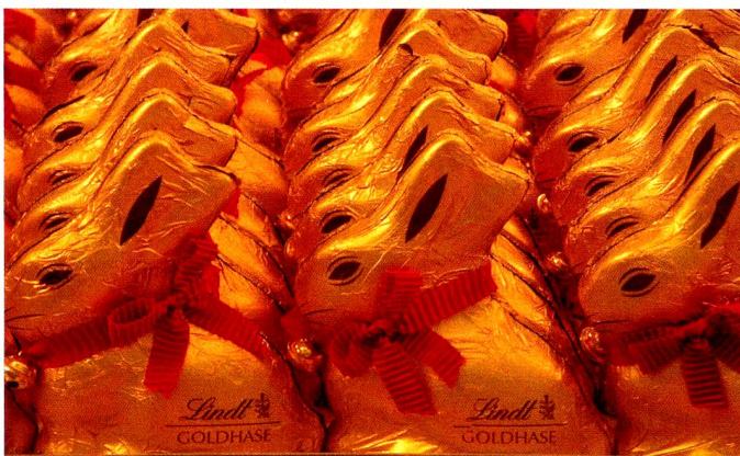
In Reih und Glied: Die klassischen Schokoladen-Osterhasen En rang et en bon ordre: les classiques lapins de Pâques

A Zurich, les enfants prennent beaucoup de plaisir au « Zwänzgerle » qui a lieu au Limmatquai. Les enfants arrivent avec leur œuf