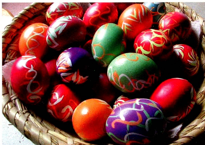
Von Ostern nicht wegzudenken: Farbenfrohe und verzierte Ostereier Pour ne pas perdre Pâques de vue : couleurs vives et œufs décorés

In Zürich wiederum haben Kinder beim «Zwänzgerle» Spass: Sie kommen mit ihren Ostereiern ans Limmatquai und