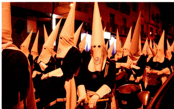
Beeindruckend: Die Prozessionen in dser Karwoche Impressionnantes : les processions de la Semaine Sainte, p.e. à Séville