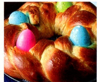
Mona - Ostergebäck aus Valencia Pâtisserie de Pâques de Valencia

Les lundi et mardi de Pâques ont lieu de nombreuses «romerías», randonnées