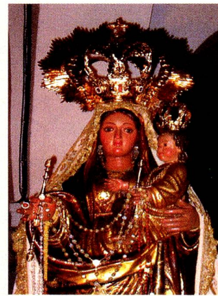
Verehrt : La Virgen del Rosario Révérée : la vierge del Rosario