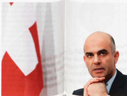
Alain Berset bei seinem ersten Auftritt vor den Medien nach seiner Wahl zum Bundesrat

Nach ihrer problemlosen Wiederwahl hat das Parlament Eveline Widmer-Schlumpf auch noch mit einem Glanzresultat zur Bundespräsidentin für das laufende Jahr gekürt. Vizepräsident ist Ueli Maurer. Neuer Vorsteher des Departements für Auswärtige Angelegenheiten (EDA) wird Bundesrat Didier Burkhalter. Der Freisinnige aus Neuenburg leitete seit seiner Wahl in den Bundesrat 2009 das Departement für Inneres (EDI). Dieses übernimmt nun Alain Berset. Die anderen fünf Bundesräte führen die gleichen Departemente wie vor den Wahlen.