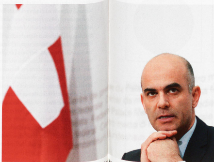
Alain Berset bei seinem ersten Auftritt vor den Medien nach seiner Wahl zum Bundesrat

Nach ihrer problemlosen Wiederwahl hat das Parlament Eveline Widmer-Schlumpf auch noch mit einem Glanzresultat zur Bundespräsidentin für das laufende Jahr gekürt. Vizepräsident ist Ueli Maurer. Neuer Vizepräsident des Departements für Auswärtige Angelegenheiten (EDA) wird Bundesrat Didier Burkhalter. Der Freisinnige aus Neuenburg leitete seit seiner Wahl in den Bundesrat 2009 das Departement für Inneres (EDI). Dieses übernimmt nun Alain Berset. Die anderen fünf Bundesräte führen die gleichen Departemente wie vor den Wahlen.